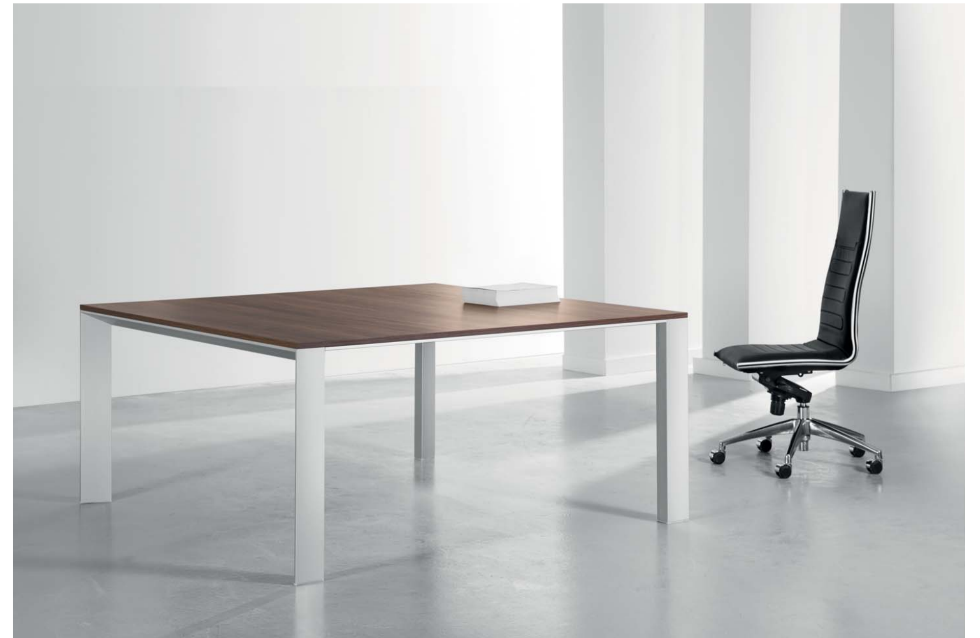
Laminated M.D.F Desktop or satinised glass inlay with diamond edges. میز جلسات دارای صفحه از جنس ام.دی.اف لمینیت دار یا شیشه رنگ سفید با لبه های دیاموند شده.