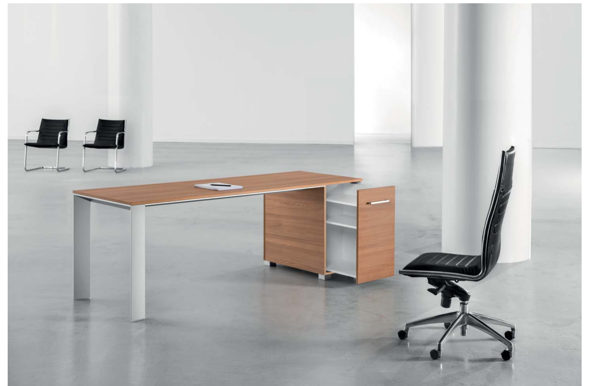
With 70cm. height unified sliding container. میزاداری دارای محفظه کشویی یک پارچه به ارتفاع ۷۰ سانتی متر.