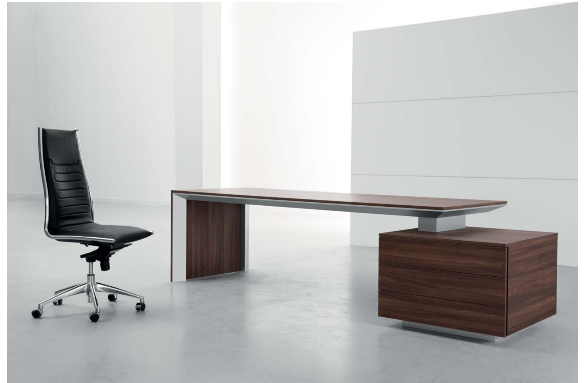
Pedestal drawer unit; Three 80 cm. width drawers. میز مدیریت دارای ست متصل به میز شامل فایل سه کشو عرض ۸۰ سانتی متر.